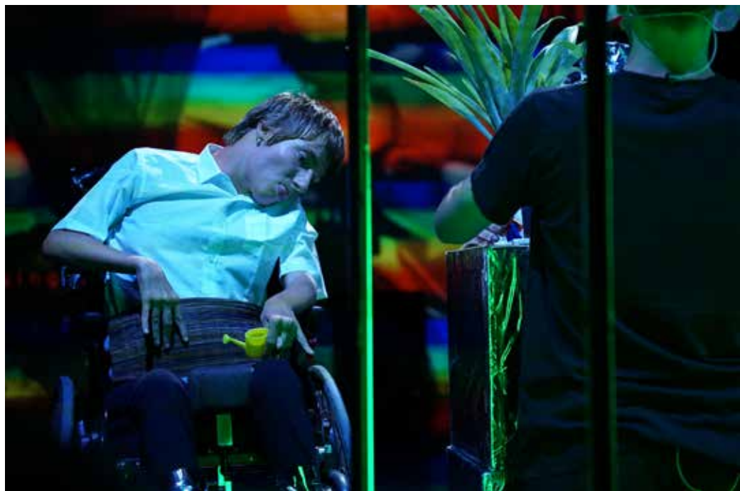
Představení "Země má" od souboru Zemětřes (2024) Představení "Země má" od souboru Zemětřes (2024)