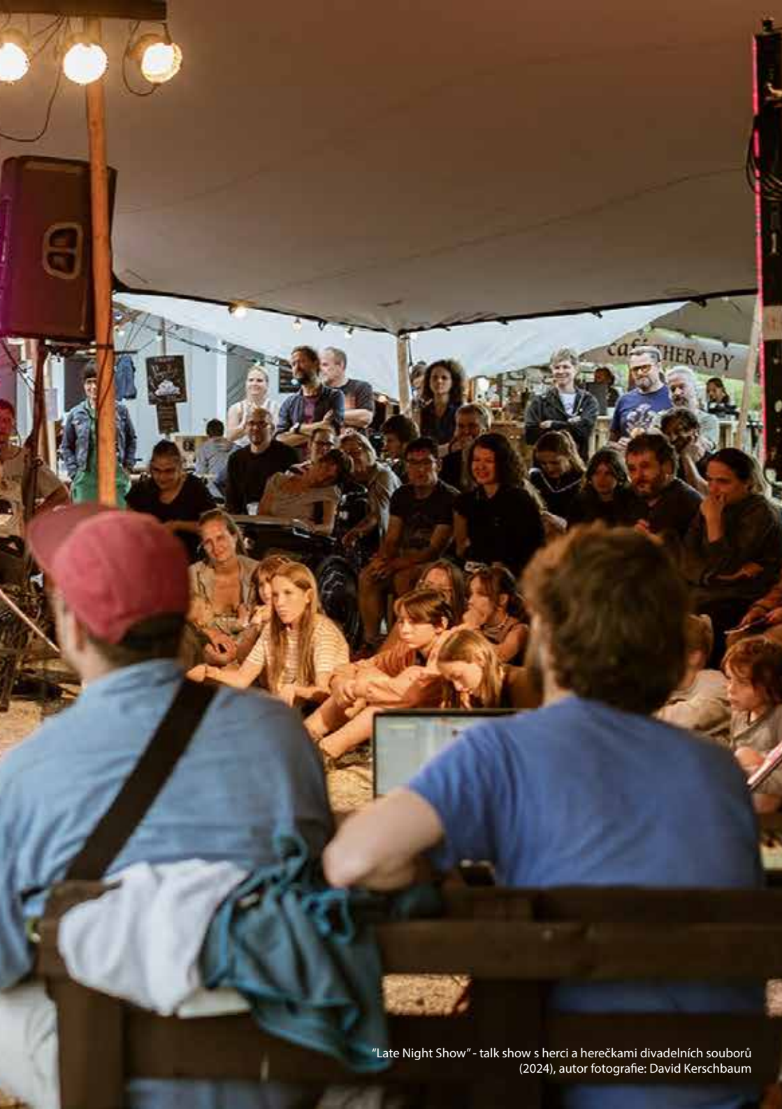
"Late Night Show" - talk show s herci a herečkami divadelních souborů (2024)