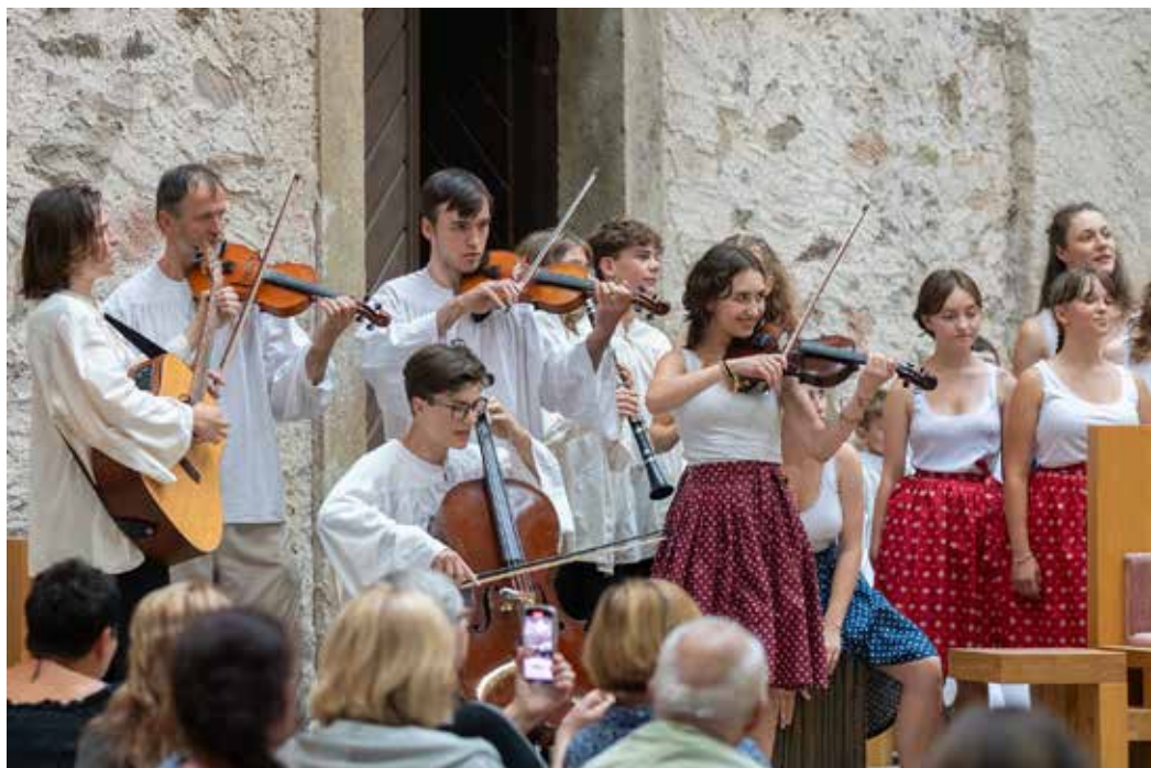
Dětské obecnstvo v zaplněném sále Taneční studio Light doprovázející zahajovací mši festivalu (2024)